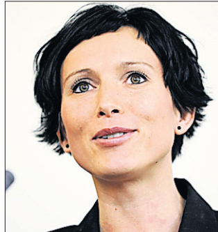
PASCAL BRUDERER 2010 auch Nationalratspräsidentin.