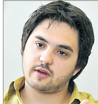
CÉDRIC WERMUTH Juso-Chef steht zur Verfügung.