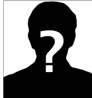
OFFEN Ein Leuchtturm ist noch zu vergeben. MZ